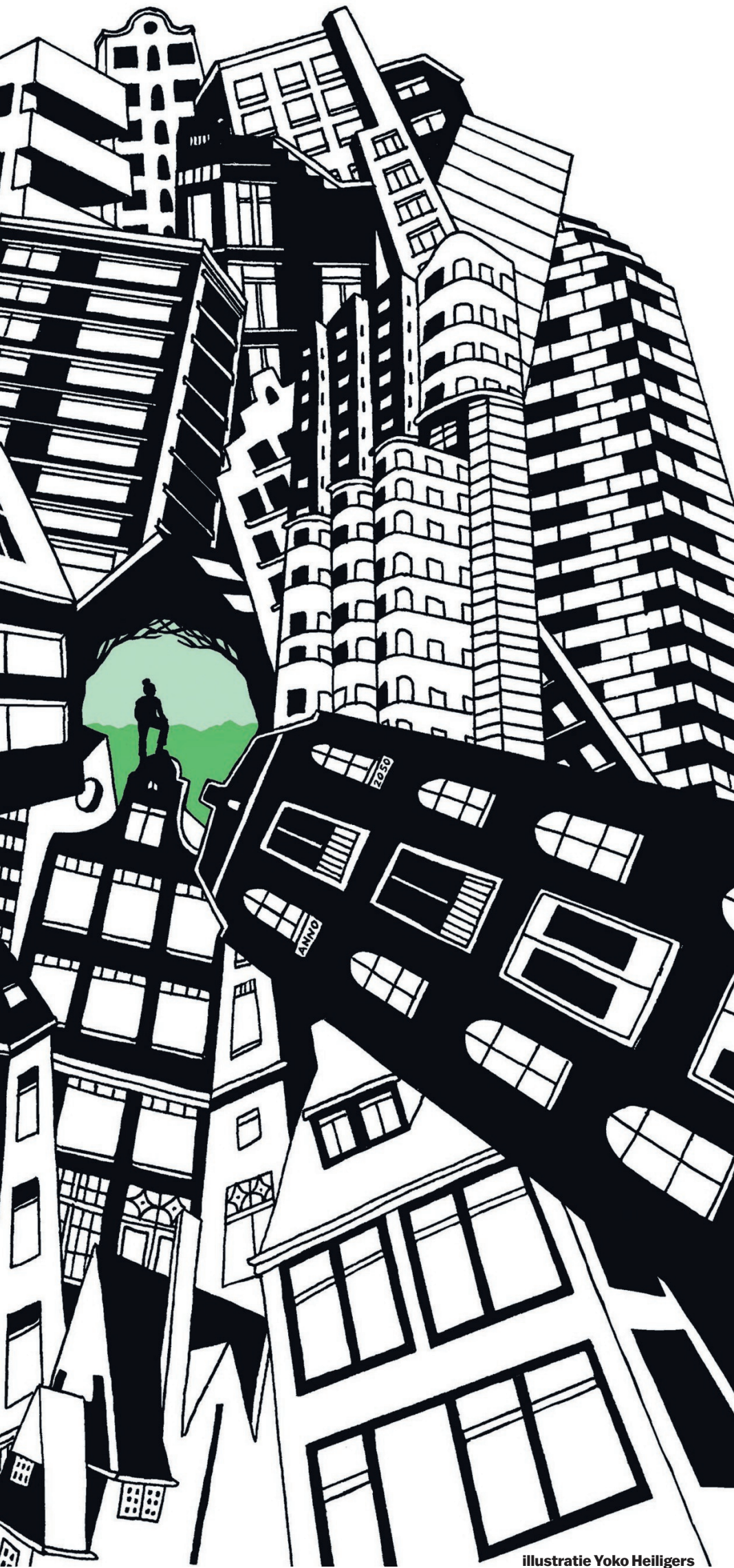
illustratie Yoko Heiligers

helpen de huidige groengebieden te ontlasten. In de regio Amsterdam geven de beheerders van bijvoorbeeld het Amsterdamse Bos, Spaarnwoude en de Gaasperplas nu al aan dat de drukte in die gebieden geregeld wordt overschreden op piekmomenten, nog los van de verwachte forse groei van het aantal bezoekers. Het Amsterdamse Bos en Spaarnwoude spannen de kroon met meer dan vijf miljoen bezoekers, maar ook de Gaasperplas en Het Twiske trekken nu al jaarlijks meer dan twee miljoen bezoekers.